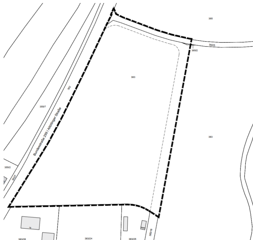
Bereich der 17. Änderung des Flächennutzungsplanes „Engelsberg“

Der genaue Umgriff des zu ändernden Flächennutzungsplanes „Engelsberg“ wird im nachfolgenden Lageplan wie folgt dargestellt: