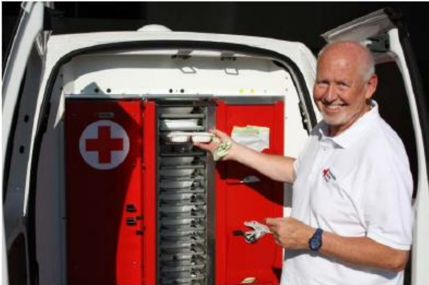
BRK-Menüservice „Essen auf Rädern“ im Einsatz